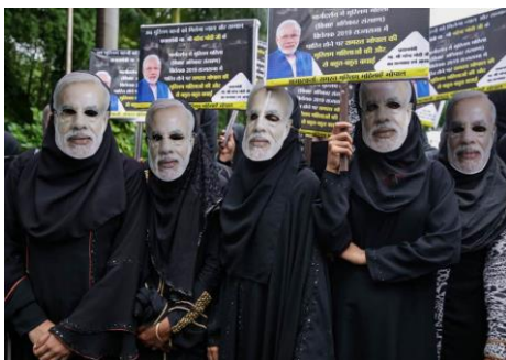
Muszlim nők Narendra Modi indiai miniszterelnök arcát ábrázoló maszkot viselnek egy eseményen, amit a Bharatiya Janata Párt (BJP) szervezett a hármastalaqot betiltó törvény elfogadásakor

Kulcs szavak: shari'a, talaq-e-biddat, iddah, mahr, India Legfelsőbb Bírósága