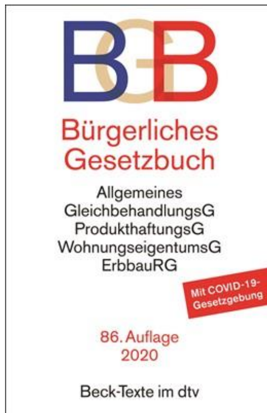
A Német Polgári Törvénykönyv 2020-as kiadása